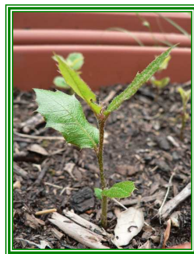
Germoglio di quercia

Credi nel tuo miraggio, credi nel tuo sogno e mettiti in cammino, perché nella ghianda c'è la quercia, nell'uovo c'è l'aquila e nei tuoi sogni c'è il germoglio della nuova realtà, che aspetta di germogliare e crescere, se tu gli dai vita.